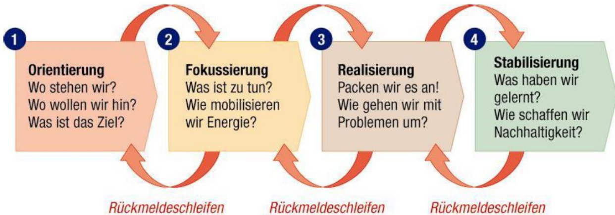
Abbildung 01: Digitalisierungsprozesse – logische Phasen des Ablaufs