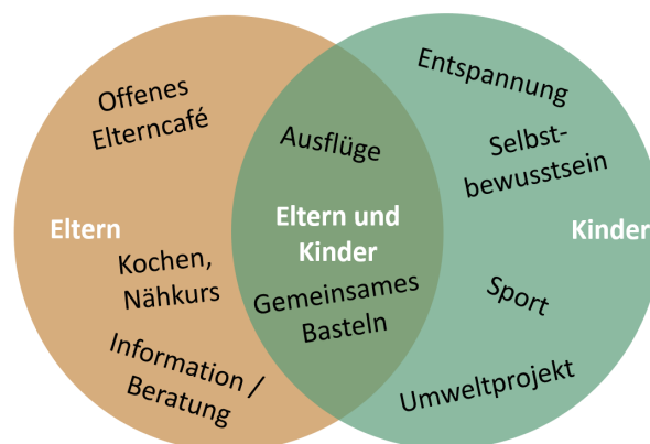
Abbildung 1: Niederschwellige FaPri-Angebote für verschiedene Zielgruppen

Um herkunftsbedingte Bildungsbenachteiligung abzubauen, setzen FaPri somit einerseits am schulischen und andererseits am familiären Kontext an und verknüpfen die formale Bildung (als Kernaufgabe von Schule), die non-formale Bildung (bspw. durch institutionalisierte außerunterrichtliche Bildungsangebote) und die informelle Bildung (also nicht institutionalisierte Bildungsprozesse, bspw. in der Familie oder in Peer-Groups). Für einen – zumindest partiellen – Ausgleich primärer Herkunftseffekte 2 sind eine enge Verzahnung der verschiedenen Bereiche und der gezielte Aufbau von Förder- und Unterstützungssystemen erforderlich. Um sekundäre Herkunftseffekte 3 zu reduzieren, müssen Eltern in ihrer Funktion als Bildungspartner ihrer Kinder gestärkt und dabei unterstützt werden, Bildungsentscheidungen zu treffen, die sich nicht an eigenen Bildungserfahrungen oder dem sozialen Status, sondern an den Potenzialen und Bedürfnissen des Kin-