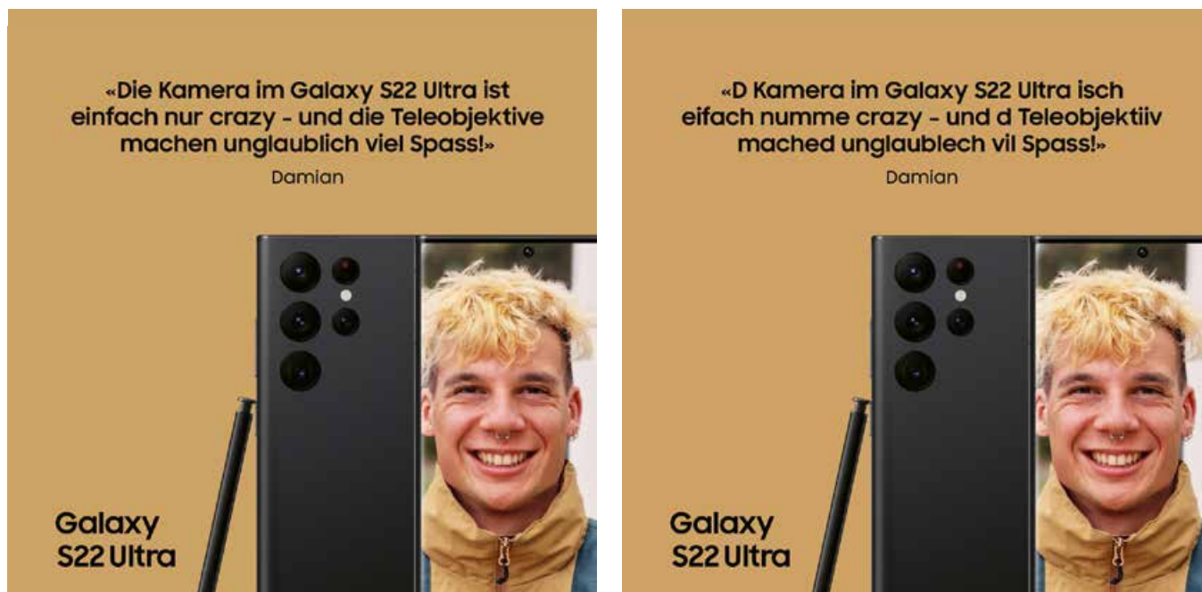
Abb. 4: Studiendesign: Standarddeutsche vs. Schweizerdeutsche Sujets