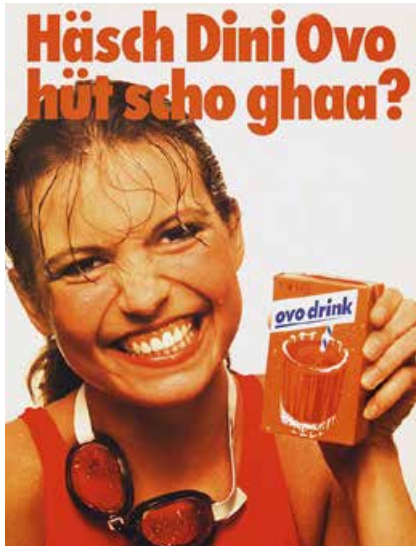
Abb. 1: Dialekt in der Schweizer Werbung