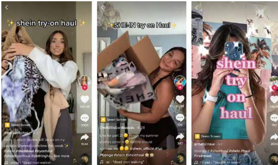
Abb. 2: SHEIN-Fashion-Hauls auf TikTok