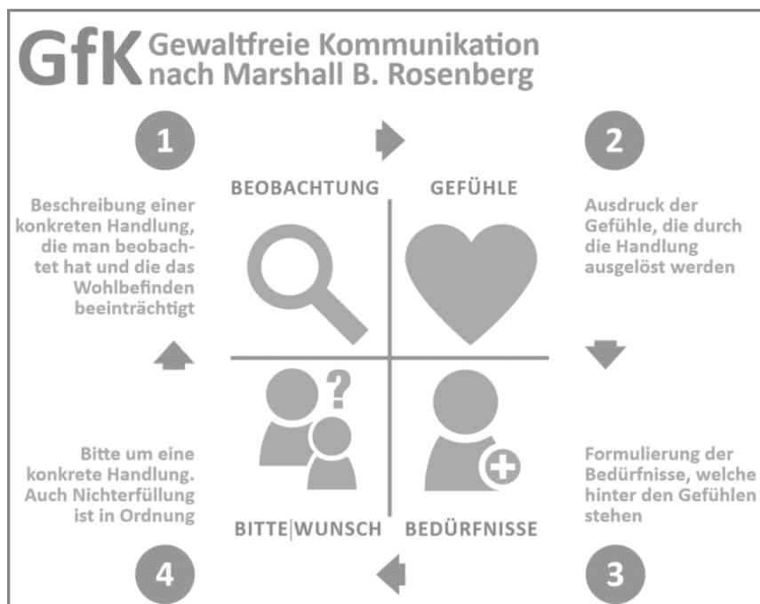
Abbildung 1: Das Modell der Gewaltfreien Kommunikation (Teamentwicklung Lab, o. J.)

In Abbildung 1 wird dieses vierstufige Modell der Gewaltfreien Kommunikation nochmals deutlich: