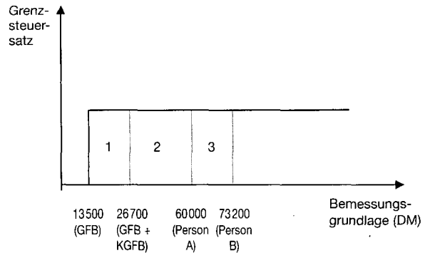
Abbildung 3 Kindergrundfreibetrag bei indirekt progressivem Tarif

de und der Alleinerziehende mit einem identischen Steuerbetrag in Höhe der Flächen 2 und 3 23 . Obwohl eine solche „flat rate tax“ international seit langem diskutiert wird 24 , bestehen hierzulande wohl keine Chancen für ihre politische Durchsetzung.