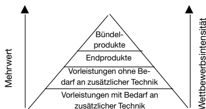
Abbildung 1 Wertschöpfungskette, Mehrwert und Wettbewerbsintensität