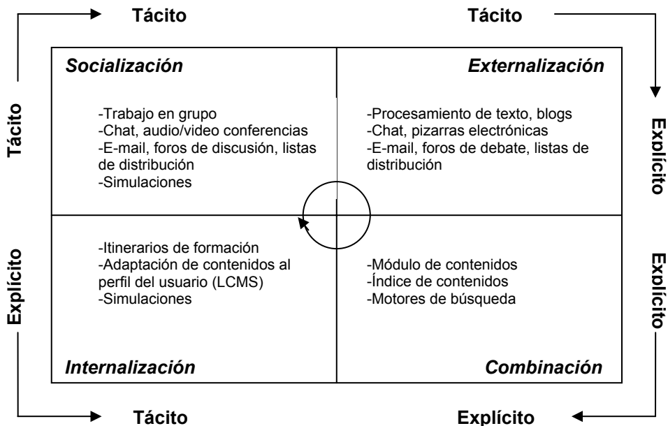
Figura 2. Modelo de integración del e-learning en el ciclo de conversión del conocimiento