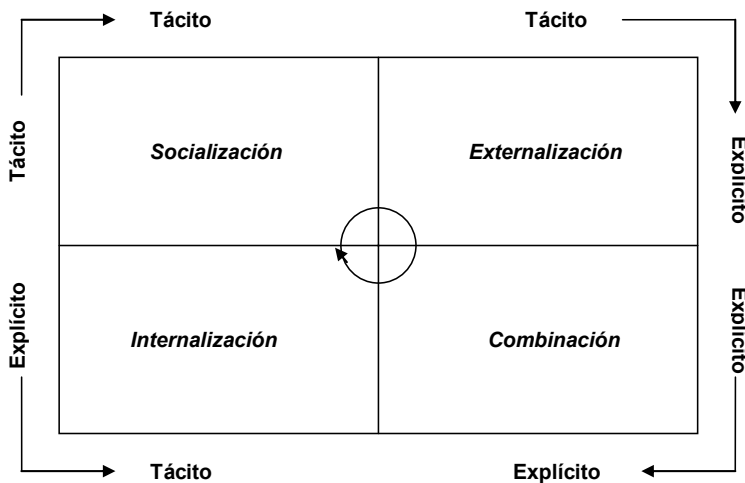
Figura 1. Modelo de conversión del conocimiento

El modelo de conversión de conocimiento descrito está representado en la Figura 1.