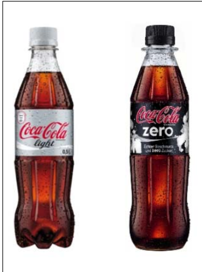
Abbildung 8: Coca Cola Light und Coca Cola Zero

Der amerikanische Getränkekonzern hat mit seinen Produkten Coca Cola Light und Coca Cola Zero (Abbildung 8) jeweils ein Frauen- und Männerprodukt auf dem Markt.