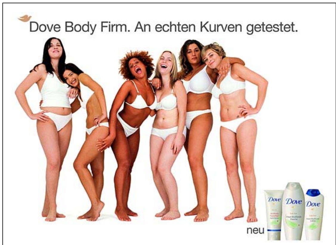
Abbildung 7: Dove Werbeanzeige

durchführen. 122 Einige der Ergebnisse waren erschreckend. So gaben 80% der befragten Frauen an, nach dem Durchblättern von Frauenzeitschriften ein geringeres Selbstwertgefühl zu haben. Fast 70% meinten, dass die Schönheitsideale, die in den Medien und der Werbung dargestellt waren, unerreichbar seien. 123 Daraufhin entwickelte Dove zusammen mit der Agentur Ogilvy & Mather die "Initiative für wahre Schönheit". 124 Seit 2005 werden in allen Dove Werbespots und Anzeigen nur noch echte Frauen gezeigt, die weder professionelle Models sind noch über perfekte Körper verfügen. Es sind normale Frauen mit denen sich die Dove -Kundinnen identifizieren können (Abbildung 7).