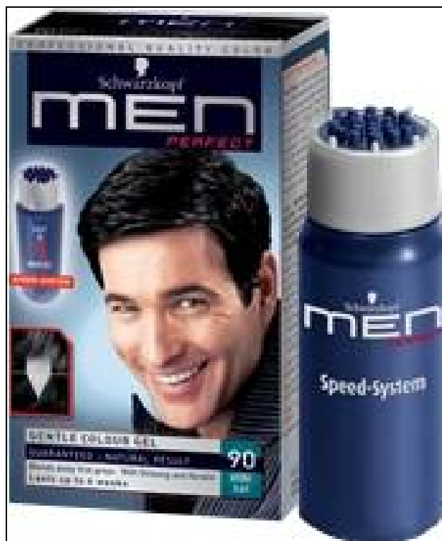
Abbildung 10: Das Haarfärbemittel Schwarzkopf MenPerfect

MenPerfect wird mit der Variante des sichtbaren Gender Marketings vermarktet. Das ist ganz logisch, da sich das Produkt so gleich von den Haarfärbemitteln, die für Frauen gedacht sind, unterscheiden lässt. Allein schon der Name und das Verpackungsdesign des Produkts machen klar, dass Männer die Zielgruppe sind.