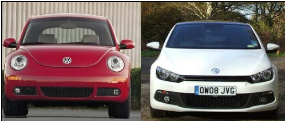
Abbildung 2: Vergleich der Frontansicht von VW Beetle und VW Scirocco

Männer dagegen werden „[...] von dem Hormon Testosteron beherrscht, das für Imponiergehabe und Kampfverhalten sorgt.“ 48 Die Front von Sportwagen oder großen Limousinen, deren Besitzer zumeist Männer sind, ist deshalb anders aufgebaut. Die vermeintlichen Männerautos haben oft ein böses "Gesicht" und strahlen Durchsetzungsfähigkeit und Stärke aus. Schmale Scheinwerfer und Kühlergrill gleichen zusammengekniffenen Augen und Lippen. 49 Durch eine breite und tiefer gelegte Karosserie wird der aggressive Eindruck noch verstärkt. 50 Solche Autos gleichen lt. Jaffé (2006, S. 151) "rollenden Drohgebärden" die den anderen Verkehrsteilnehmern die Kraft ihrer meist männlichen Fahrer demonstrieren sollen. Auf der Abb. 2 ist der Unterschied zwischen dem typischen Frauen- und Männerauto sehr deutlich zu erkennen.