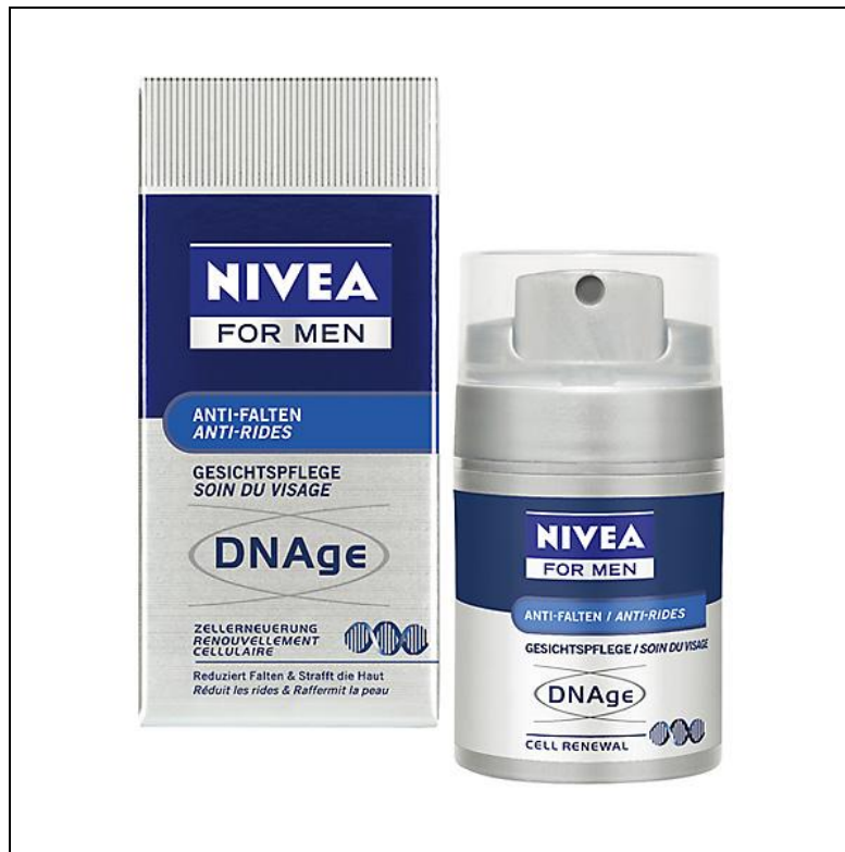
Abbildung 5: Nivea for Men Gesichtsscreme für Männer

Die sichtbare Vermarktungsmethode kann allerdings auch problematisch sein. Wenn man bei bestimmten Produkten eindeutig "for Women" oder "for Men" darauf schreibt, grenzt das die Zielgruppen eventuell zu stark ein. Auch ein zu weibliches Design, wie beispielsweise Blümchenmuster oder rosa Farbe wirkt in manchen Fällen eher abstoßend oder sogar diskriminierend. Frauen wollen nicht unbedingt ein Frauenprodukt. 64 Besonders bei Produkten, die grundsätzlich von beiden Geschlechtern gleichermaßen genutzt werden, eignet sich die Variante des unsichtbaren Gender Marketings besser.