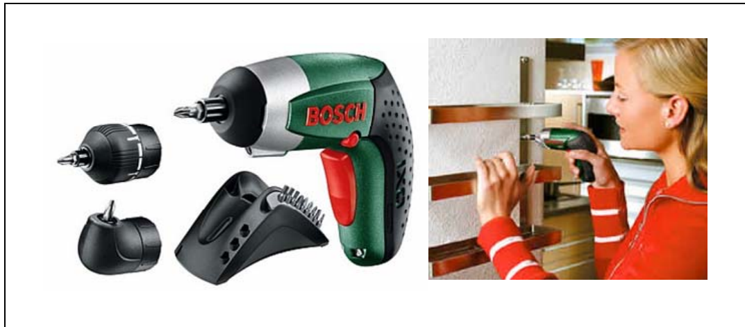
Abbildung 6: Bosch IXO Akkuschauber

Die Bosch AG beispielsweise hat im Jahr 2003 einen Akkuschauber speziell für Frauen entwickelt (vgl. Abbildung 6). 65 Dieser ist kleiner, leichter und einfacher zu bedienen, als die ursprünglichen, primär für männliche Handwerker entwickelten Modelle. Dabei hat Bosch aber nicht darauf verzichtet, auch die männlichen Wünsche nach neuester Technik und einer starken Akkuleistung umzusetzen. 66