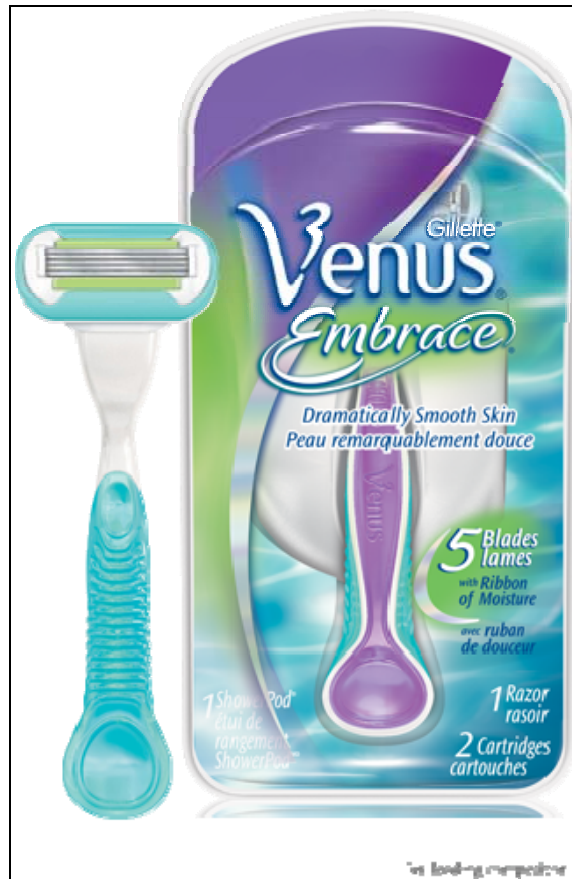
Abbildung 4: Damenrasierer Venus Embrace von Gillette

Der Damenrasierer Venus von Gillette ist ein Paradebeispiel, an dem sich zeigen lässt, wie sichtbares Gender Marketing erfolgreich umgesetzt werden kann (vgl. Abbildung 4). 62