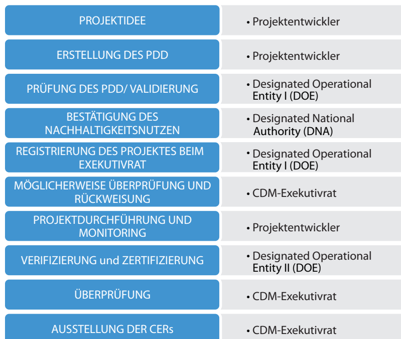
Abbildung 1: Der CDM- Projektlauf

Während der nun folgenden Projektumsetzung ist die Dokumentation und Überprüfung der erzielten Emissionsreduktionen anhand des im PDD festgelegten Überwachungsplans (Monitoringplan) von zentraler Bedeutung. Dieser, während der Projektumsetzung von den Projektentwicklern erstellte Monitoringbericht, wird im Anschluss an eine weitere DOE 17 zur Verifizierung gesendet. Dabei prüft diese, ob die angegebenen Emissionsreduktionen tatsächlich erzielt wurden und zertifiziert das Projekt, wenn es keine Beanstandungen gibt (UNFCCC, 2001: 17/CP.7./Annex I.). Eine Art Monitoring des Nachhaltigkeitsnutzens findet bisher nicht statt! Nach der Genehmigung durch die DNA des Gastgeberlandes wird von keiner weiteren Instanz überprüft, ob das Projekt während seiner Umsetzung tatsächlich zur nachhaltigen Entwicklung des Gastgeberlandes beiträgt. Dies ist jedoch essentiell, um sich der in der Theorie gemachten Versprechungen zu vergewissern. Ein Grund für das Fehlen einer solchen Überprüfung könnte der damit verbundene zusätzliche Kostenaufwand sein.