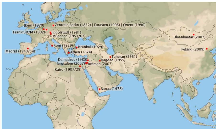
Abb. 1: Standorte der Abteilungen und Kommissionen des DAI

Aufgrund seiner im Ausland durchgeführten Feldforschungsprojekte wie Ausgrabungen, Surveys, Expeditionen und Restaurierungsmaßnahmen, der Organisation von Kongressen und Vortragsreihen, der Vergabe von Stipendien an Gastwissenschaftler sowie der Zusammenarbeit mit internationalen Kooperations- und Projektpartnern ist das DAI ein wichtiger Teil der auswärtigen Kulturpolitik des Auswärtigen Amtes. Dabei geht es einerseits um die Erforschung kulturhistorischer Fragestellungen zum besseren Verständnis der Menschheitsgeschichte, andererseits um Aspekte an der Schnittstelle zwischen Archäologie, Bibliothekswesen und Informationstechnik.