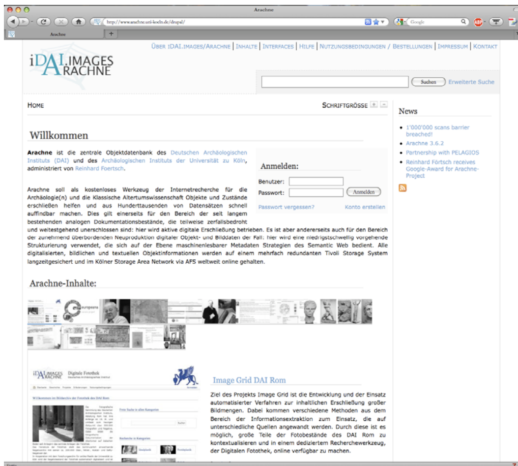
Abb. 4: Startseite von ARACHNE

ARACHNE versucht, Interoperabilität zwischen unterschiedlichen Systemen zu schaffen und gleichzeitig die Urheberrechte der Erzeuger zu schützen – einer der zentralen Punkte in der Zusammenarbeit des DAI mit dem CoDArchLab. Der Datenaustausch zwischen ARACHNE als zentraler Objektdatenbank, iDAI.field als umfassendem Dokumentationssystem und den unterschiedlichen, auf Ausgrabungen und Surveys benutzten GIS spielt eine immer größere Rolle, um bei der Datenhaltung die Redundanz von Informationen möglichst gering zu halten. Ein weiteres Vorhaben seitens des DAI ist das Bereitstellen von URIs (Universal Resource Identifier) für alle digital erfassten Objekte. Auch die Einbindung des Metadatenmodells CIDOC-CRM 10 und der Open Archives Initiative 11 ist von