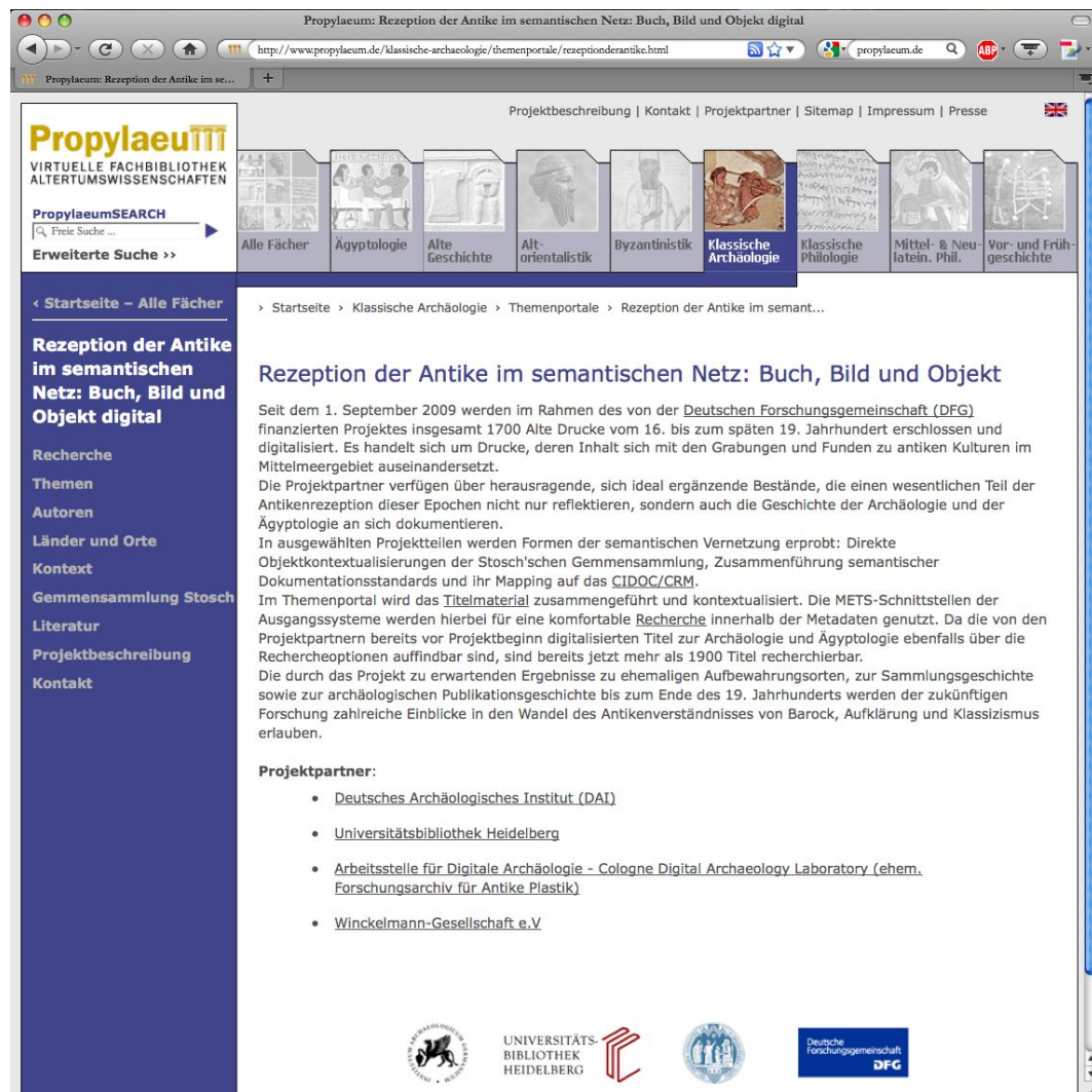
Abb. 7: Das Themenportal »Rezeption der Antike im semantischen Netz« innerhalb von Propylaeum

Interoperabilität auf einer anderen Ebene wird in dem Projekt CLAROS umgesetzt. 24 Hierfür haben sich mehre internationale Institutionen zusammengeschlossen, um ihre Datenbestände zur klassischen Antike in einer einzigen Weboberfläche recherchierbar zu machen. Beteiligt sind neben dem DAI das Beazley Archive (Schwerpunkt Antike Vasenmalerei) und das Lexicon of Greek Personal Names (Schwerpunkt Griechische Inschriften und Prosopografie) an der Universität Oxford, das Lexicon Iconographicum Mythologiae Classicae (Schwerpunkt Antike Mythologie) an den Universitäten Basel und Paris sowie das Cologne Digital Archaeology Laboratory (Schwerpunkt Antike Skulptur). Alle