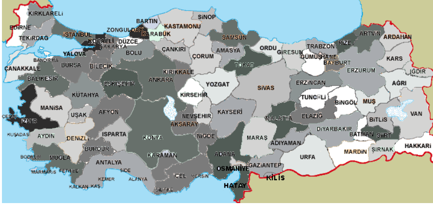
Harita 11: Kişi Başına Gerçel Kamu İmalat Sanayi Katma Değeri 1980-1990