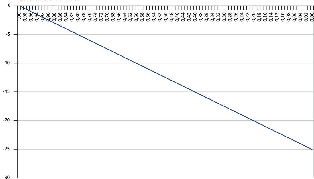
GRÁFICO 2 Demanda por hedge intertemporal pelo título de longo prazo em função do grau de tolerância ao risco 1

Nota 1 : O eixo vertical é a participação percentual (%) do título de longo prazo na riqueza do investidor, enquanto o eixo horizontal é o grau de tolerância ao risco do investidor, dado pelo inverso do grau de aversão ao risco.