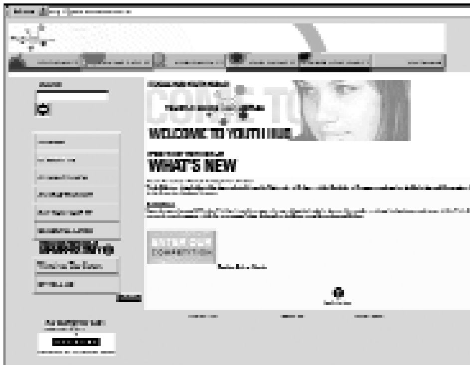
Abbildung 2: Youth Hub

Die Grundlagen zu Youth Hub bildeten die Ergebnisse der Jugendstudie »Reality Bytes« 26 zu Haltungen von Jugendlichen gegenüber Ihren technischen Fertigkeiten und Ihrer Karriere. Die Studie zeigte, daß Jugendliche: