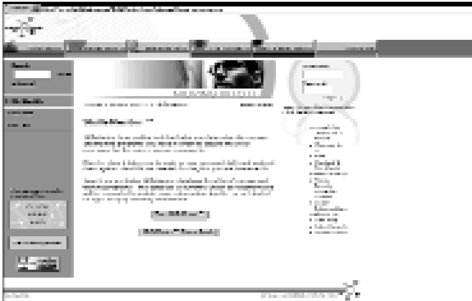
Abbildung 3: IT Skills Hub – Skills Mentor

Im Detail heißt das: Nach dem Einstieg können die UserInnen entweder gleich in eine Weiterbildungsdatenbank mit unterschiedlichen Suchfunktionen weiterklicken oder in den Skills Mentor einsteigen. Dort wird man zuerst aufgefordert, unter den angeführten und kurz beschriebenen Arbeitsfeldern auszuwählen. Wurde ein bestimmtes Berufsfeld ausgewählt, können die UserInnen unter »Skills Profile« eine Liste von dazu benötigten Skills aufrufen und haben die Möglichkeit jene anzukreuzen, über die sie bereits verfügen. Eine Analyse des »Skills Gap« und die Inanspruchnahme von weiteren, speziell für die einzelnen Berufsfeldbeschreibungen bereitgestellten Serviceleistungen, wie z.B. zusätzliche Informationen, Ausbildungsangebote, Jobbörsen etc., ist nur nach einer Registrierung möglich.