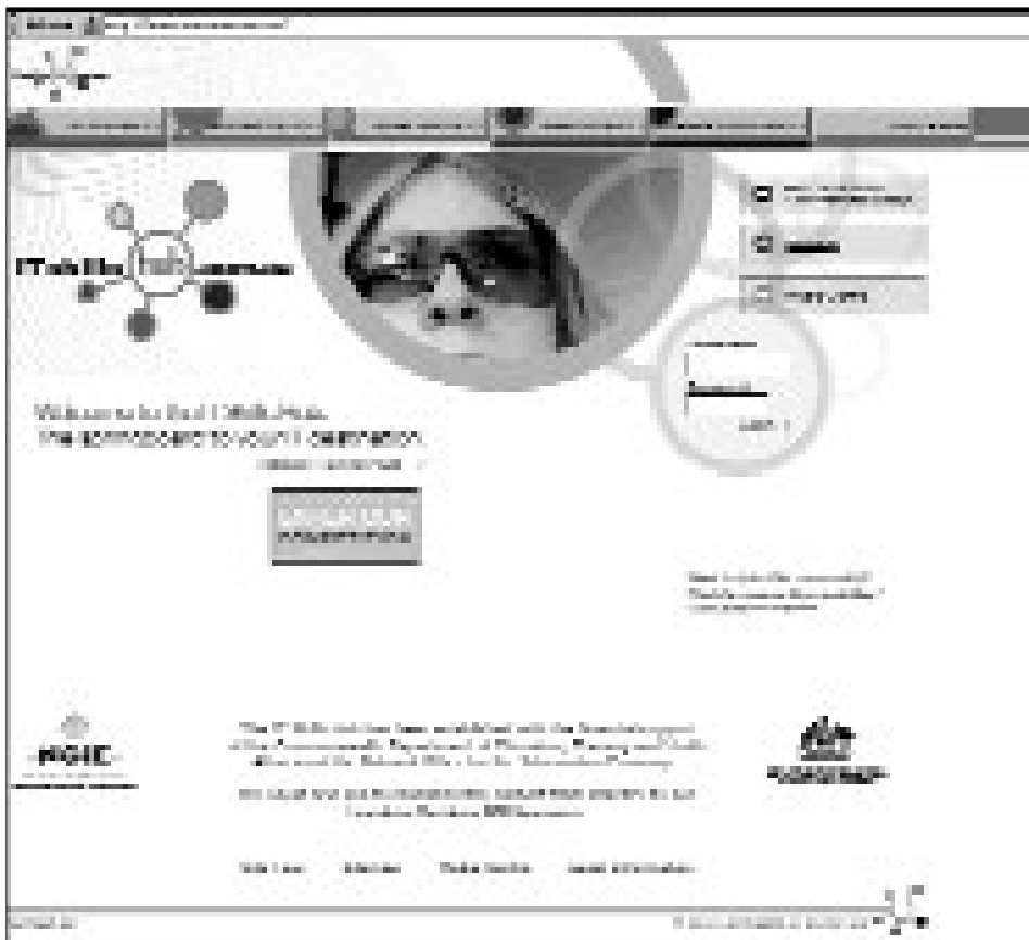
Abbildung 1: IT Skills Hub

IT Skills Hub ist eine Art elektronischer Marktplatz, der auf den steigenden Bedarf an IT-Qualifikationen in Australien ausgerichtet ist. Es finden sich neben Brancheninformationen und neuesten Trendinformationen zu Aus- und Weiterbildungsangeboten auch unterschiedliche Dienstleistungen. IT Skills Hub ist eine Art Treffpunkt für Individuen und Agenturen mit IT&T 25 -Skills, IT&T-Angeboten und IT&T-Lösungsvorschlägen und wird sowohl von den großen »IT&T-Playern« als auch von Regierungsseite unterstützt und getragen.