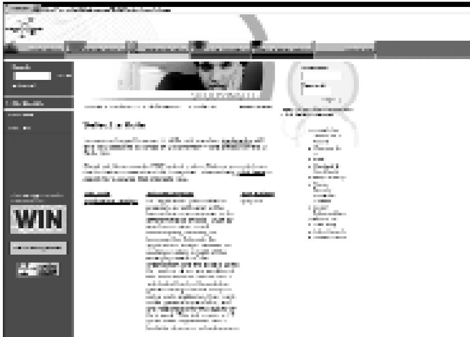
Abbildung 4: IT Skills Hub – Skills Mentor (Registering/Anmeldung)

Es werden drei thematische Linklisten in der Website angeboten. Diese sind: