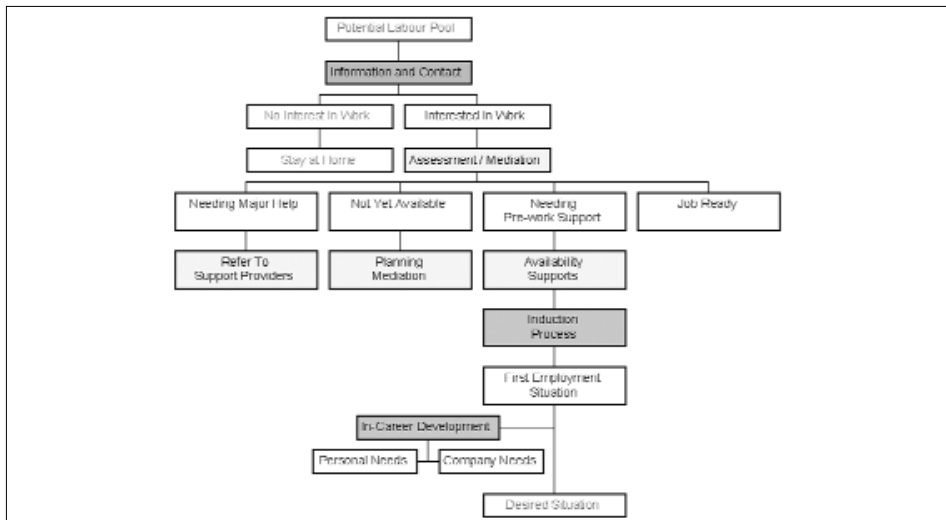
Abbildung 7: Schema von Expanding the Workforce for Women

Weitere Informationen: Fiona Nolan (Northside Partnership), Tel.: +353 1 8485630