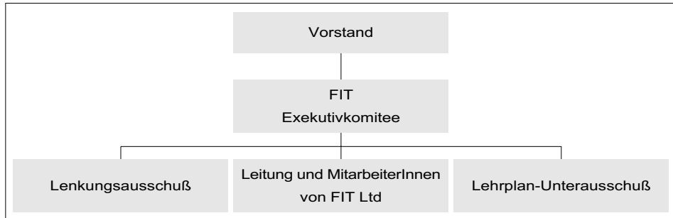
Abbildung 5: FIT-Organigramm:

Die geschätzten Kosten für die Implementierung des Programmes innerhalb der geplanten drei Jahre sind 25,39 Millionen Euro. Es wird mit Einsparungen in der Höhe von 38,08 Millionen Euro gerechnet (reduzierte Ausgaben für Arbeitslosenversicherungsleistungen und eine Erhöhung der Einnahmen aus Einkommenssteuer und Sozialversicherung). Die Schulungskosten trägt die öffentliche Hand über bestehende Schulungseinrichtungen. Die Managementkosten des Programmes werden für den Dreijahreszeitraum knapp über eine Million Irische Pfund (ca. 1.235.440 Euro) betragen. Diese werden zum Großteil von der IT-Industrie unter Kofinanzierung durch die irische Regierung aufgebracht. KursteilnehmerInnen erhalten während der gesamten Kursdauer Ausbildungsarbeitslosengeld in der Höhe des vorangegangenen Arbeitslosengeldes.