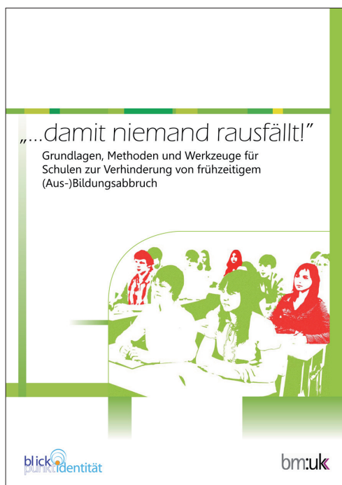
Abbildung: Publikation »... damit niemand rausfällt!«

An der BHAK Wien 10 werden seit dem Schuljahr 2011/2012 alle Produkte des Projektes in den Aufnahmeprozess sowie die anschließende Schuleingangsphase eingegliedert und kommen auch hier überaus erfolgreich zum Einsatz. Als Beratungsressource steht seit Februar 2012 das Jugendcoaching zur Verfügung. Ein weiteres Pilotprojekt ist die Anwendung der Stop-Dropout!-Tools an fünf Wiener berufsbildenden und höheren Schulen.